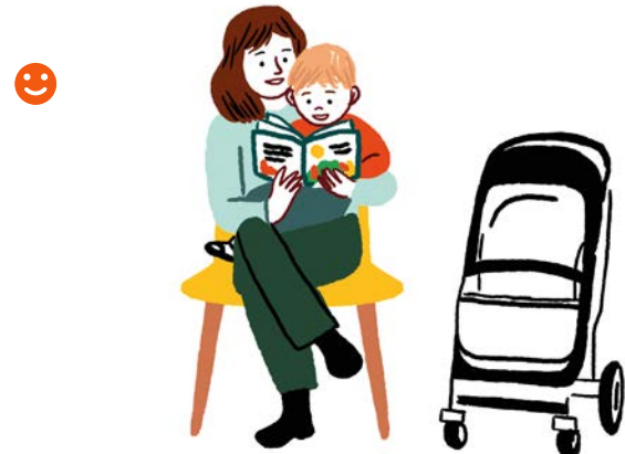
Avant un rendez-vous