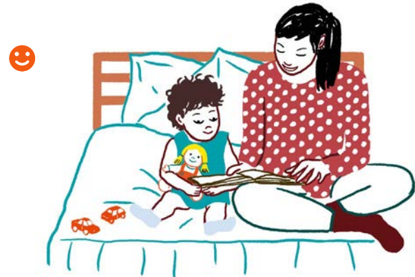
Avant de dormir